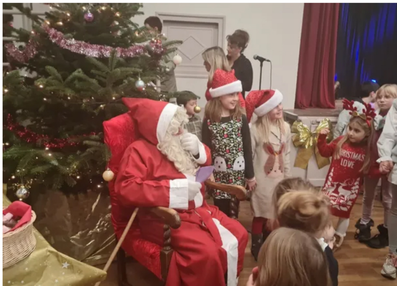
Cent neuf enfants du personnel attendaient le Père Noël.